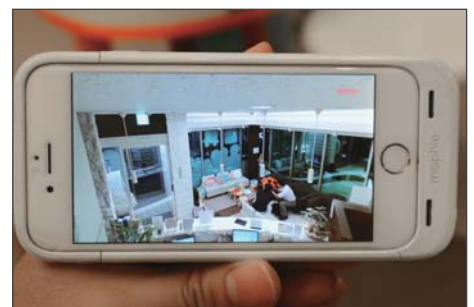
受付後方に設置したカメラの映像。スマホで入口から受付、待合室まで全体を見渡せる

360度自動追尾カメラを導入したことで、当医院の防犯は確実にアップしました。同時に、（見守りの安心感でしょうか）待合室のお客様からもカメラ設置について良いお声をいただきます。当医院の印象も確実にアップしましたね。