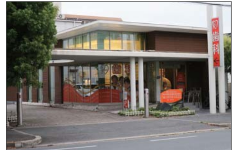
2013年に開業。清潔感のある設備や親切な診療対応が、口コミなどでも好評を得ている

吹田市の江坂エリアで地域に根差した診療を行っている歯科クリニック。歯科医療を通じた社会貢献を目指して、お客様のあらゆるニーズに応えるべく、院長をはじめスタッフ一同努力されています。 URL: http://www.k-dc.me/